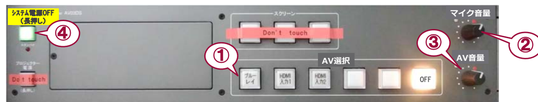
システムスイッチャ

① 出力映像の選択 ② マイク音量調節 ③ AV音量調節 ④ システム終了 ※長押し