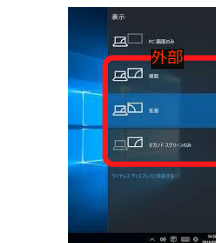
外部出力設定 切り替え画面