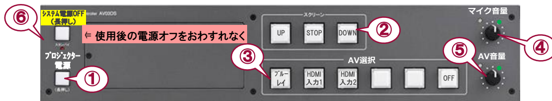
システムスイッチャ