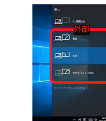
外部出力設定 切り替え画面