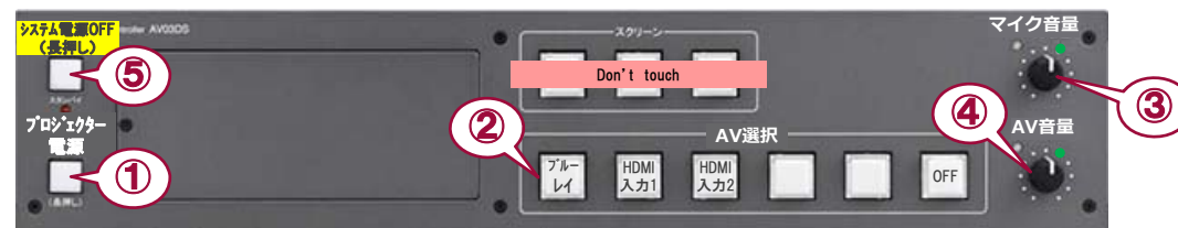
システムスイッチャ

② 出力映像の選択 ③ マイク音量調節 ④ AV音量調節 ⑤ システム終了 ※長押し