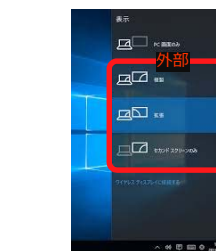
外部出力設定 切り替え画面