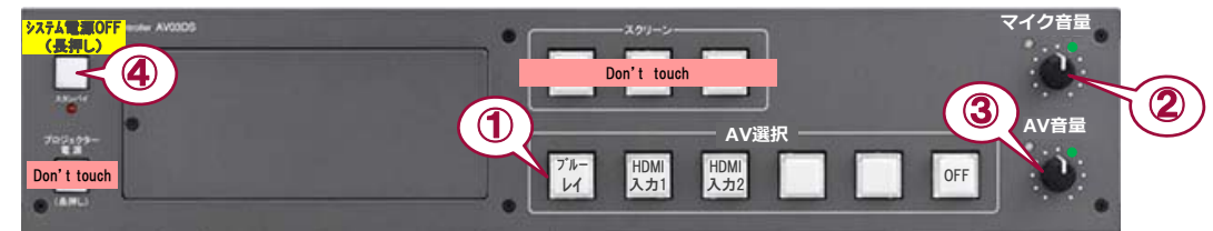
システムスイッチャ

① 出力映像の選択 ② マイク音量調節 ③ AV音量調節 ④ システム終了 ※長押し