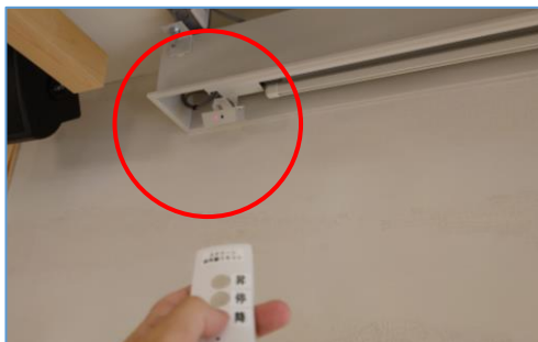
スクリーン赤外線受光部