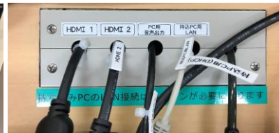
外部入出力ケーブル