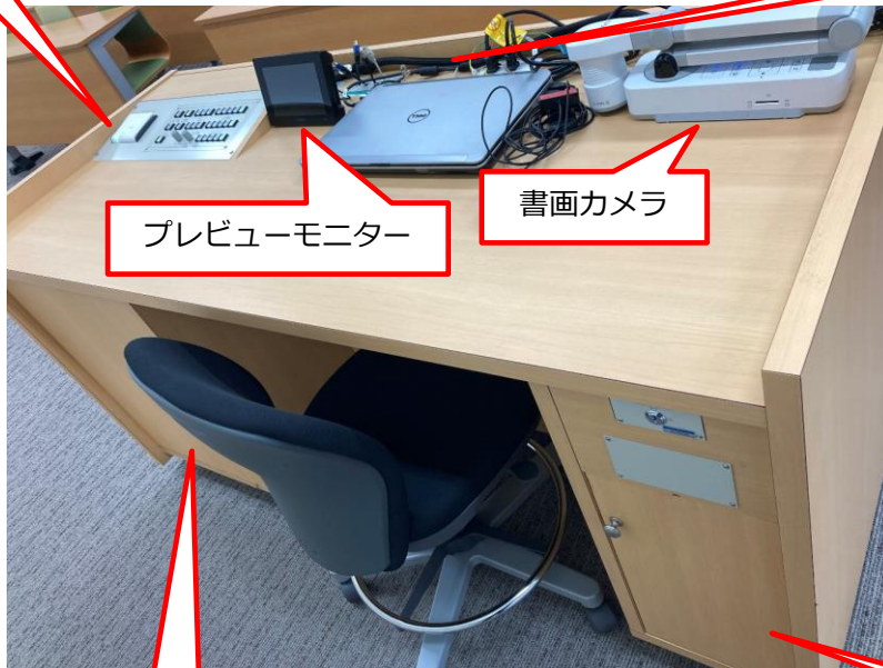
プレビューモニター