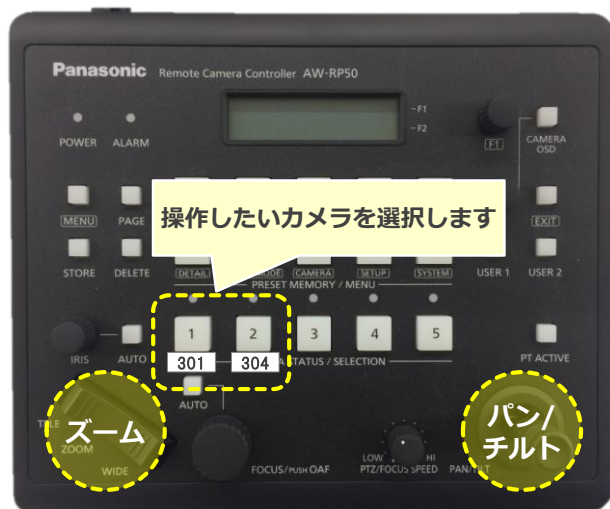
カメラコントローラー

講師や黒板の撮影用に、カメラが設置されています。 カメラモニターを見ながらカメラコントローラーを操作してください。 こちらから相手カメラの操作も可能 です。