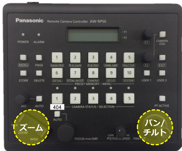
カメラコントローラー

黒板前に、受講者を撮影するためのカメラが設置されています。 カメラモニターを見ながら カメラコントローラー を操作してください。