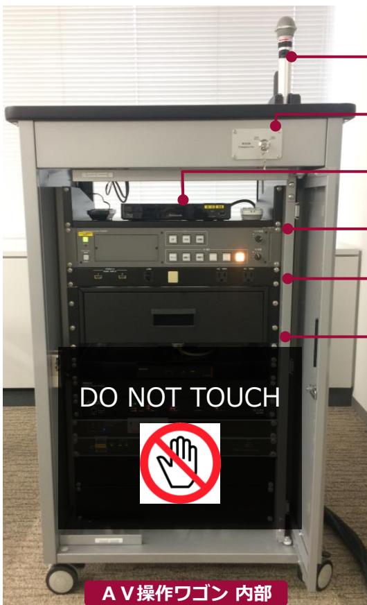
ワイヤレスマイク