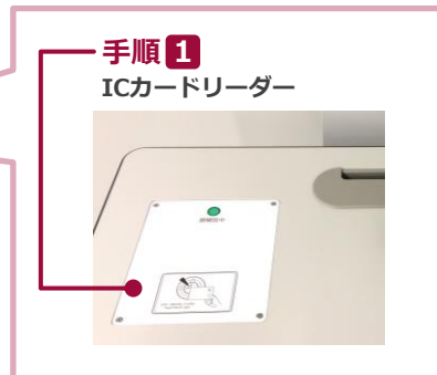
手順 1 ICカードリーダー