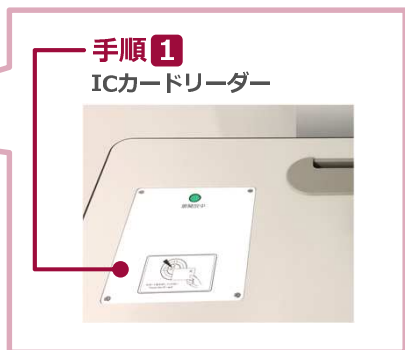
手順1 ICカードリーダー