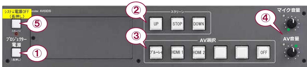
システムスイッチャ